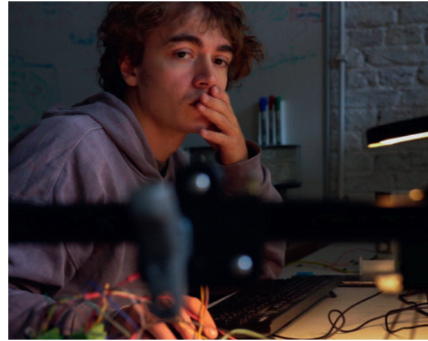
ÉLIE BOLARD, DÉS-AFFECTATIONS 30 avril 2025 - Art au Centre Liège

Élie Bolard (Pontarlier, 1999) développe une pratique centrée sur les technologies contemporaines, interrogeant leur fonctionnement et le monopole du savoir technique. Ses installations et sculptures mêlent un langage artisanal et industriel. Toutes ces installations sont motorisées et intrinsèquement sonores : l'électronique est visible et les mécanismes audibles. Ces machines font écho à un monde standardisé où le geste est omniprésent. L'automatisation joue un rôle essentiel dans son travail, tant d'un point de vue théorique et critique que visuel. Dotées d'une intelligence et de réactions propres, ces machines invitent le spectateur à les considérer comme des êtres à part entière. Tout est en mouvement, tout est vivant, mais l'être humain n'est plus invité, ou se trouve réduit au rôle de producteur.