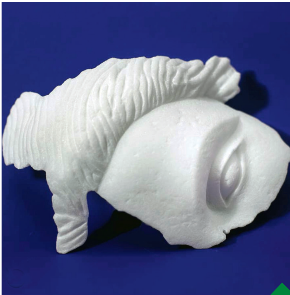
JULIEN DISCRIT Kintsugi , 2018 - Marbre de Carrare Courtesy Galerie Anne Sarah Benichou © Julien Discrit

Biennale 2026, Julien Discrit expose à Pontarlier à la Chapelle de l'Espérance.