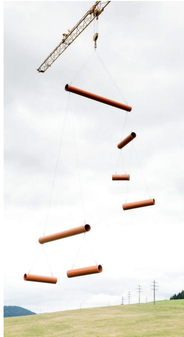
DENIS ROUCHE, CHANTIER MOBILE - 2021