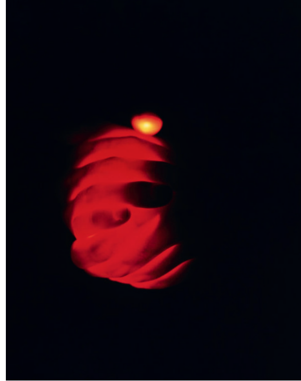
JULIEN DISCRIT Brighter than a thousand suns - 2007 Photographie. Tirage couleur à développement chromogène sur papier contrecollé sur aluminium - 80 × 60 cm Acquisition 2007

avec le soutien de la Fondation Pernod Ricard Produit avec le soutien de la Fondation des Artistes