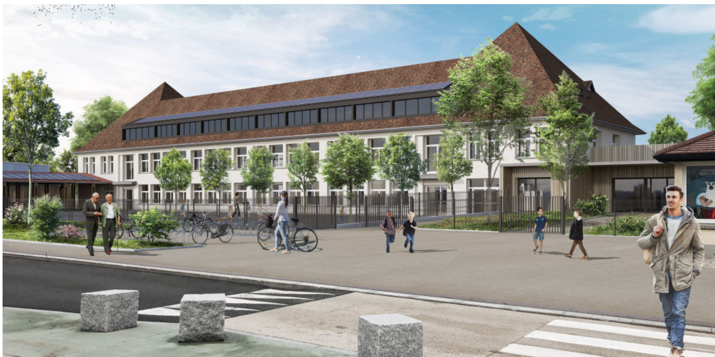
Vue 3D du futur pôle enfance jeunesse de Frasne

Nos enfants et personnels pourront ainsi profiter d'un équipement agréable, isolé et fonctionnel. Avec l'école maternelle en face de l'école primaire et le tout nouveau multi-accueil, les familles trouveront dans cette zone un véritable pôle enfance jeunesse .