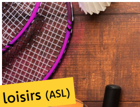
Sport et loisirs (ASL)

Conformément à la loi AGEC, de nouvelles filières de tri sont mises en place dans les déchèteries du Haut-Doubs*: