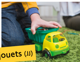
Jeux et jouets (JJ)