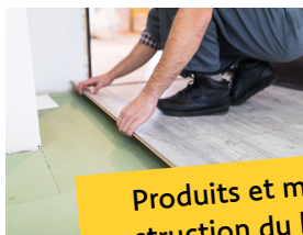
Produits et matériaux de construction du bâtiment (PMCB)

Le tri en déchèterie se trouve modifié par ces nouvelles filières.