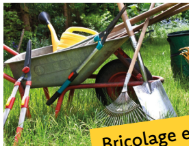
Bricolage et jardin (ABJ)